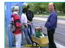
Bollerwagentour in Helsa